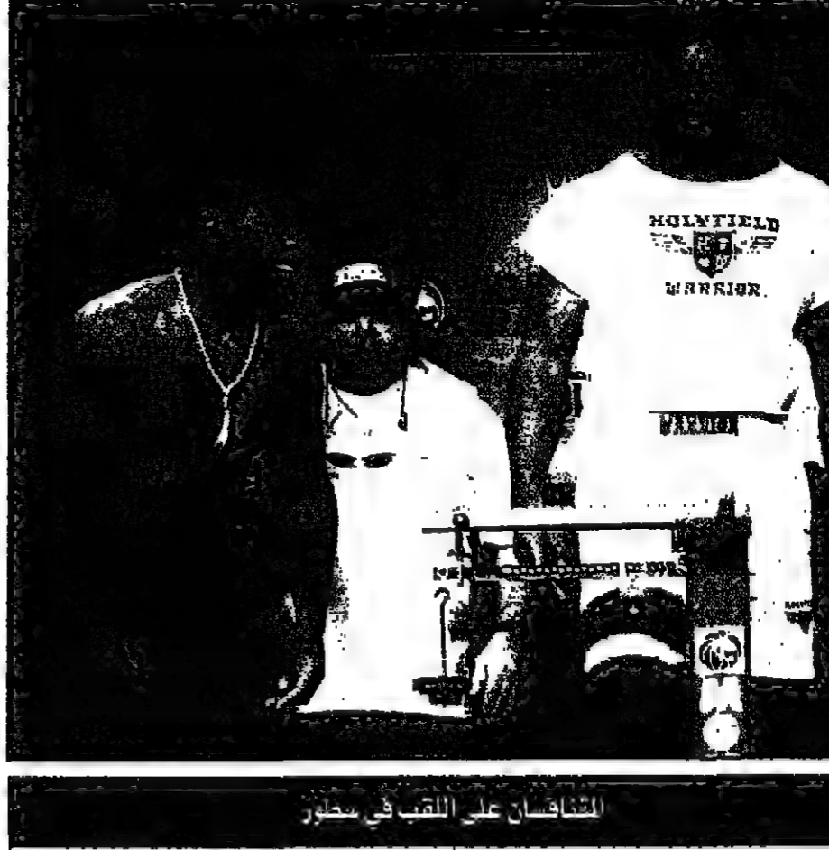
المتنافسان على اللقب في سطر

لاس فيغاس - رويترز: توقع خبراء كثيرون ان يفوز للملك ايفاندر هوليويكيد مرة اخرى على مايك تايسون في المباراة التي تقام بينهما اليوم السبت على بطولة رابطة الملاكمة العالمية في الوزن الثقيل.